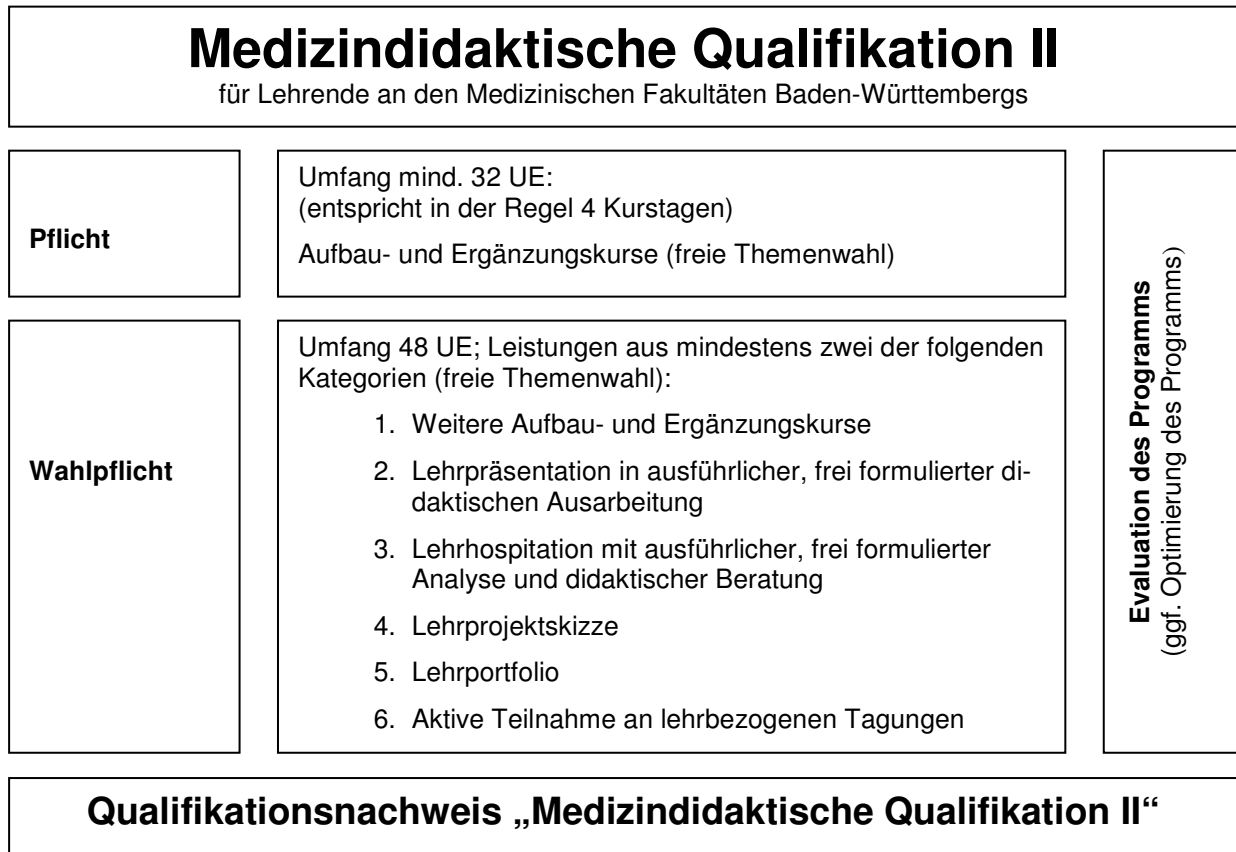
Abbildung 3: Struktur des Modul II (Medizindidaktischen Qualifikation II)

Wer sich als Lehrende/r über die allgemein geforderte Grundausbildung hinaus noch weiter qualifizieren möchte, hat im Modul II die Möglichkeit zur individuellen Schwerpunktbildung. Ziel ist, die persönlichen Stärken und Interessen auszubauen und Fertigkeiten über die bereits bestehenden Stärken hinaus gezielt zu erwerben (→ individuelles Lehrprofil). Somit bietet unser Gesamtprogramm für Lehrende und Fakultäten den Vorteil, dass die Medizindidaktische Qualifikation I berechenbar ist, durch das Aufbau- und Ergänzungskurse aber Personen mit einem individuellen Lehr- und Erfahrungsprofil gezielt ausgebildet und dementsprechend auch angeworben werden können (→ gezielte Fakultätsentwicklung).